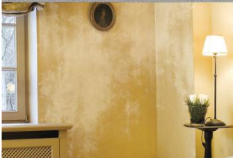
สีเป็นด่างเป็นดวง Fading