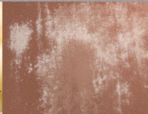
สีเป็นคราบเกลือ Efflorescence