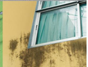
สีขึ้นราและตะครัน้ำ Fungi and Algae