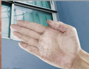
สภาพพื้นผิวฟุ้งซอสต์ Chalking